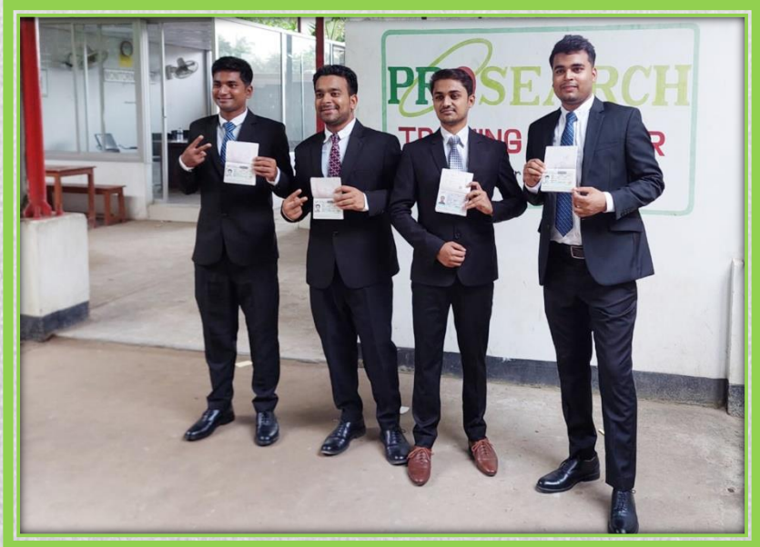
溶接の技能実習生