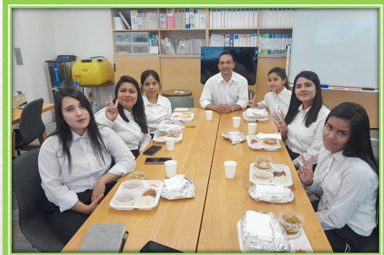
家事支援の技能実習候補生