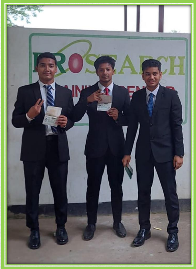
溶接の技能実習生