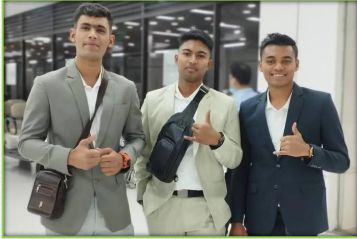
建築業務の技能時修正