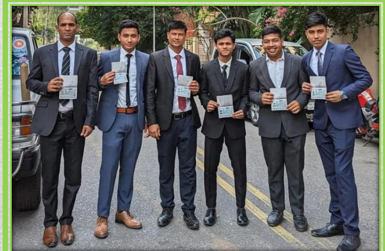
農業関係の技能実習生