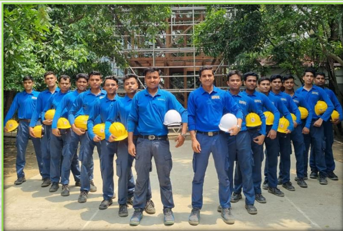
実習生の大工作業研修