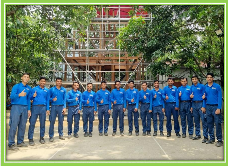
建設関係の技能実習生