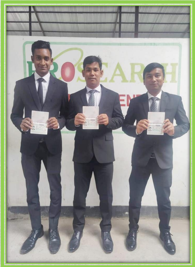
溶接の技能実習生