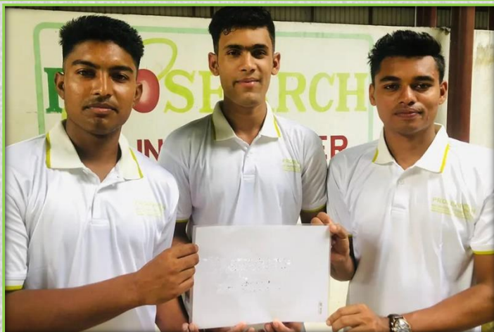
建設関係の技能実習生